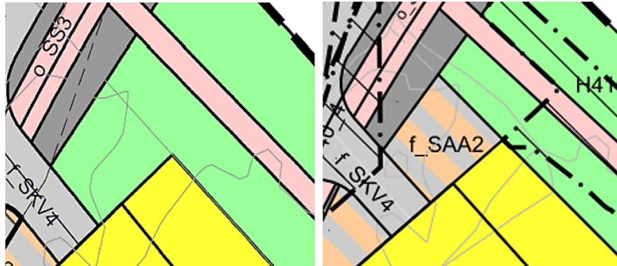
Figur 3: Utsnitt av plan 1657 til venstre, utsnitt av plan 1657A til høyre

Deler av grønnstruktur foreslås endret fra formål o_G2 til formål f_SAA2 – samferdselsanlegg/ tekniske infrastrukturtraseer/ kombinasjonsformål. Dette anses som mer hensiktsmessig, bl.a. fordi området har renovasjonsløsning og mye trafikk.