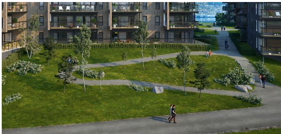
Figur 7: Formål SAA1 med blokk A i bakgrunnen (ill.: Salgsprospekt)