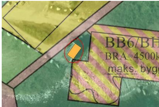
Figur 1: Pumpestasjon markert med oransje, ift. formål i gjeldende plan 1657 (ill.: Plannotat Sweco)

Gjennomføring av planen krever flytting av pumpestasjon for avløp, som nå ligger nær boliger og barnehage (formål BB6/BHG (F)). Dette er ikke hensyntatt i reguleringsplanen, og det må gjøres endringer for å sette av areal, og sikre rettigheter for framtidig drift.