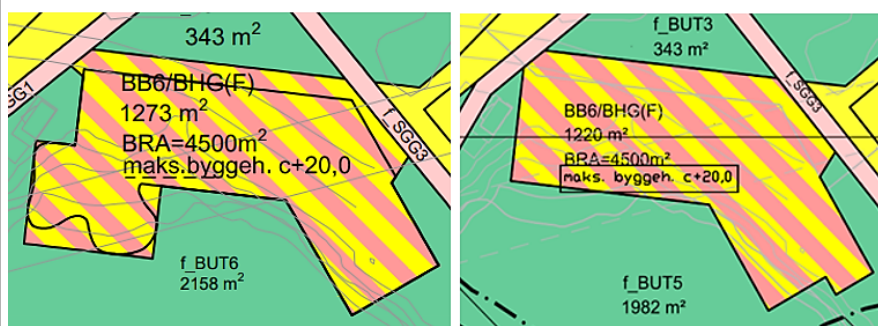
Figur 6: Utsnitt av plan 1657 til venstre, utsnitt av plan 1657A til høyre

Endringen omfatter utforming av formål bolig/tjenesteyting BB6/BHF(F). Forslaget innebærer en reduksjon i grunnflate fra 1 273 m 2 til 1 220 m 2 , og en mindre sammensatt form. Endringen er et resultat av byggesak for bygg BB6 (F), med innvilget dispensasjon.