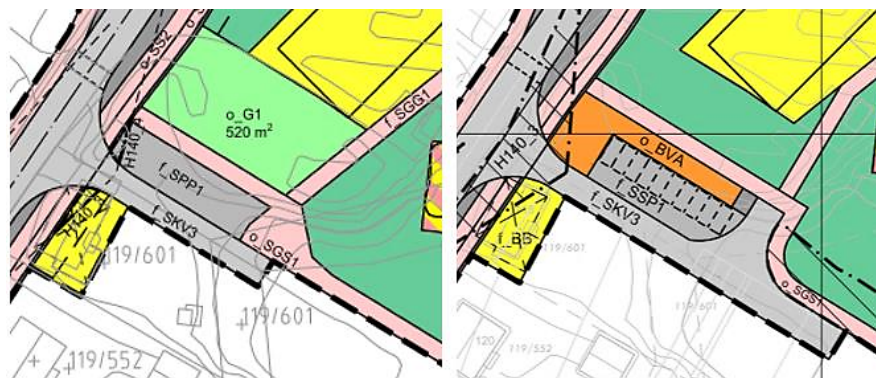
Figur 5: Utsnitt av plan 1657 til venstre, utsnitt av plan 1657A til høyre

Opprinnelig pumpestasjon for VA, jf. Figur 1, er her lagt inn som formål o_BVA. Snuhammer legges inn av hensyn til renovasjonsbil. Kurvaturen til o_SGS1 må endres som følge av dette.