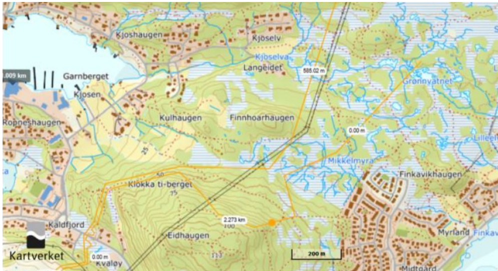
Reinbeitedistriktet sitt forslag til oppsamlingsgjerd og ledegjerde ved Eidhaugen merka med gul linje.