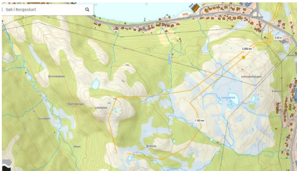
Reinbeitedistriktet sitt forslag til oppsamlingsgjerd og ledegjerde ved Storfjellet/Skaveldalen merka med gul linje

Ved eventuelt framtidig behov for kontrollert flytting av rein og etablering av gjerdeanlegg langt utanfor denne reguleringsplanen sitt planområde, slik det framkjem i kartutsnitta over, vurderar administrasjonen at dette uansett må skje med grunnlag i breidare medverknad med andre berørte partar i området. Her har administrasjonen i saksframlegget også skrive at det i tilknytning til føreståande revisjon av kommuneplanen sin arealdel, vil vere behov for å vurdere desse problemstillingane for reindriften på Kvaløya.