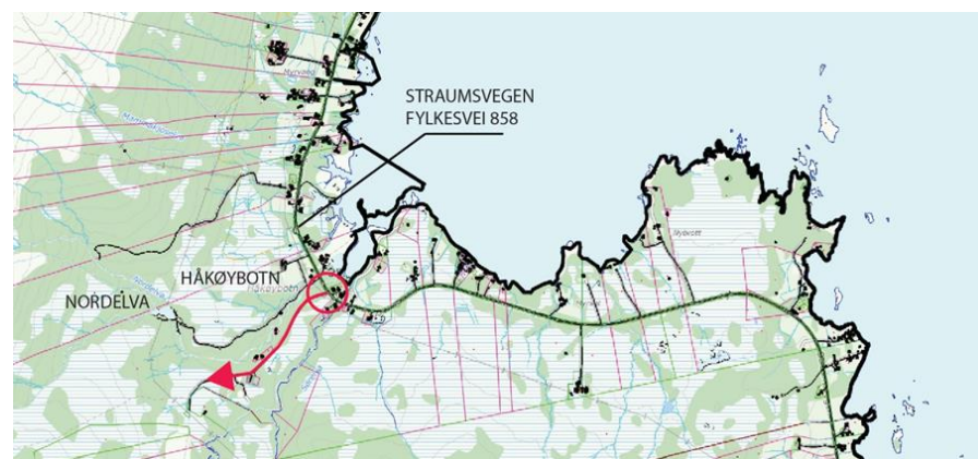
Figur 5: Adkomstveg markert med rød pil. Illustrasjon: Nordic

Adkomstveg frem til parkering- og snuplass er hovedsakelig planlagt i samme trasé som eksisterende grusveg. Adkomstveien har en lengde på ca. 1530 meter. Det er planlagt gang- og sykkelvei langs hele veiens nordside som forbinder kollektivholdeplass og parkeringsplasser. Ny veg og adkomst vil gi bedre trafiksikkerhet og være i stand til å håndtere større trafikkmengde.