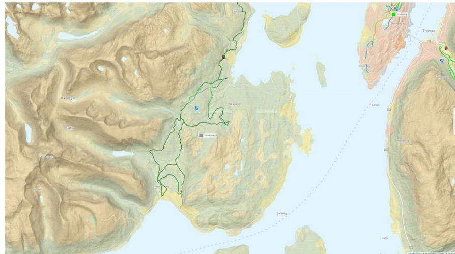
Figur 3: Skiløyper fra Eidkjosen til Straumbukta. Illustrasjon Nordic

Det skal etableres en langrennstrasé gjennom planområdet som erstatter den eksisterende langrennstrasé. Der langrennsløypa krysser nedfartene kan det etableres kulverter eller bruer. Der langrennsløypene krysser vei, kan det etableres bru eller kulvert for planfri kulvert. Langrennstraseen gjennom planområdet vil bli en del av løypenettet Eidkjosen-Straumbukta.