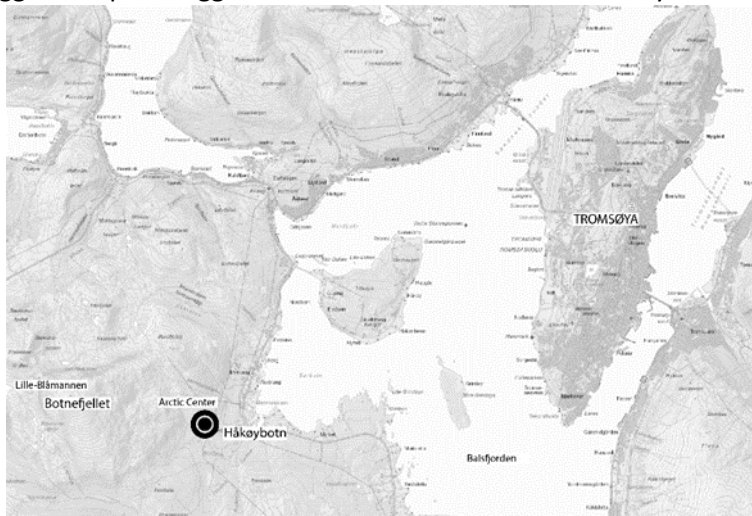
Figur 2: Lokalisering. Illustrasjon: Nordic

Nordic – Office of Architecture og lhuga arkitekter har på vegne av Arctic Center AS utarbeidet et forslag til detaljreguleringsplan hvor det foreslås å tilrettelegge for alpinanlegg med tilhørende infrastruktur i Håkøybotn.