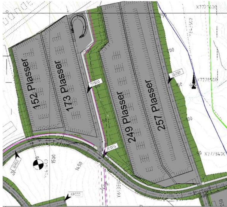
Figur 6: Parkeringsplass ved bunnstasjon. Illustrasjon: Nordic

Planområdet ligger ikke innenfor dagens bygrense, men med ca. 18 km fra Tromsø sentrum anses likevel alpinanlegget for å ligge sentralt.