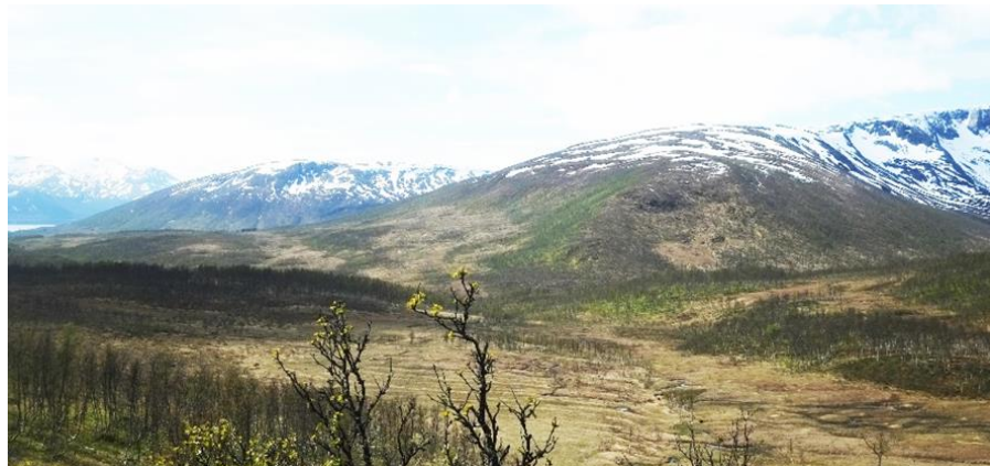
Figur 4: Nordelva og Lille-Blåmann.

I vintersesongen når anlegget er dekket av snø vil anlegget fremstå som et alpinanlegg, mens anlegget utenfor sesong vil ha et mindre helhetlig uttrykk og i større grad vil være preget av inngrepene, spesielt i vegetasjonsbeltene.